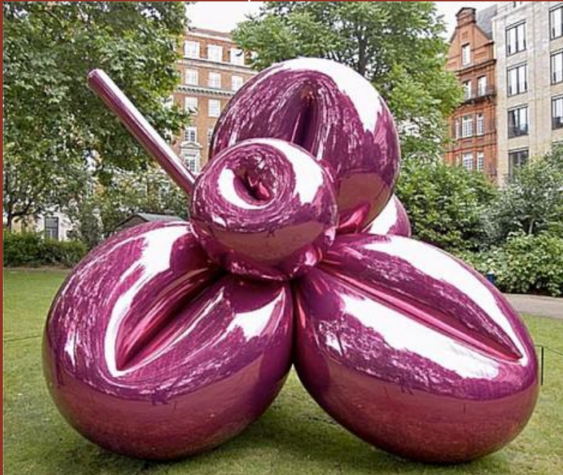
Balloon Flower— J. Koons