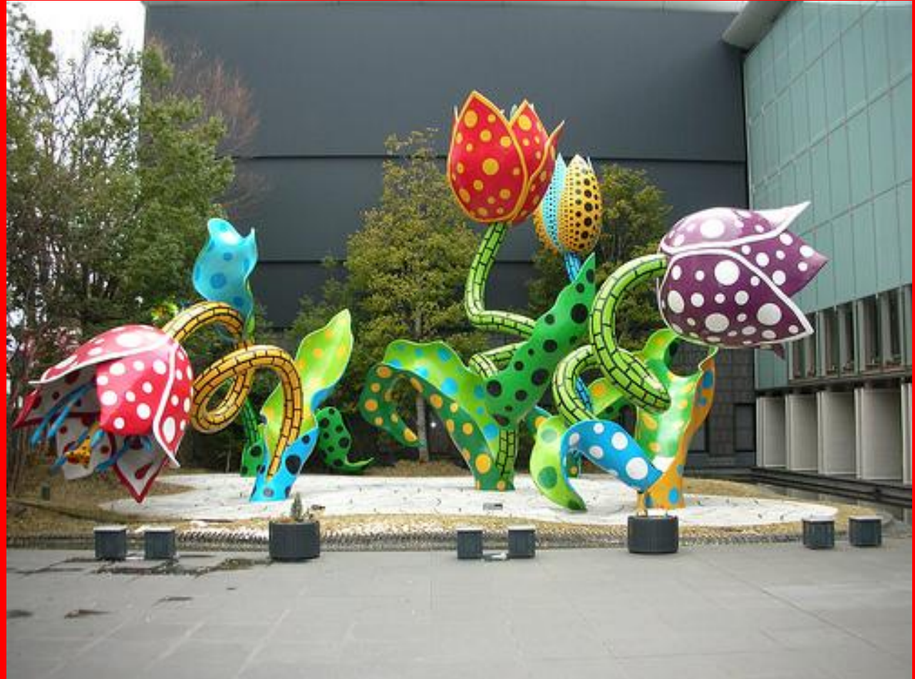
Les tulipes de Shangri-La

Coder personnages et situations d'un récit et le traduire en images à l'instar des contes illustrés par W. Lavater.