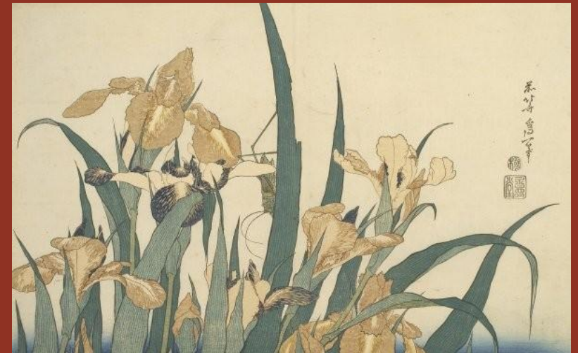
Grandes fleurs, iris et sauterelle - Hokusai vers 1833-1834