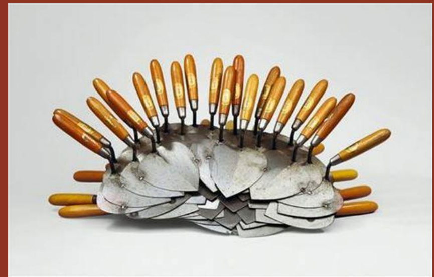
Fleurs aquatiques - Arman, 1980