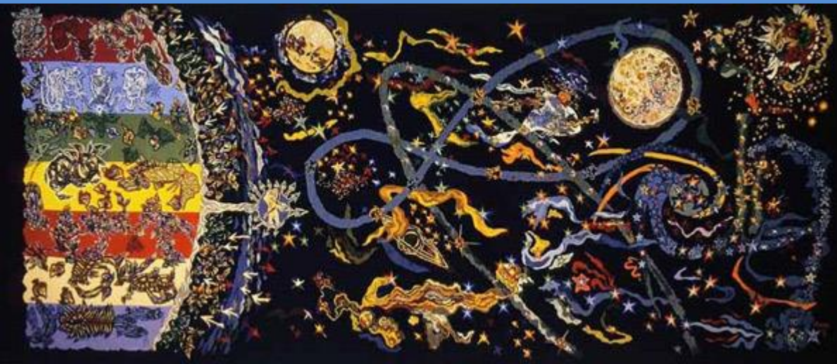
J. Lurçat, Conquête de l'espace, 1960, Angers