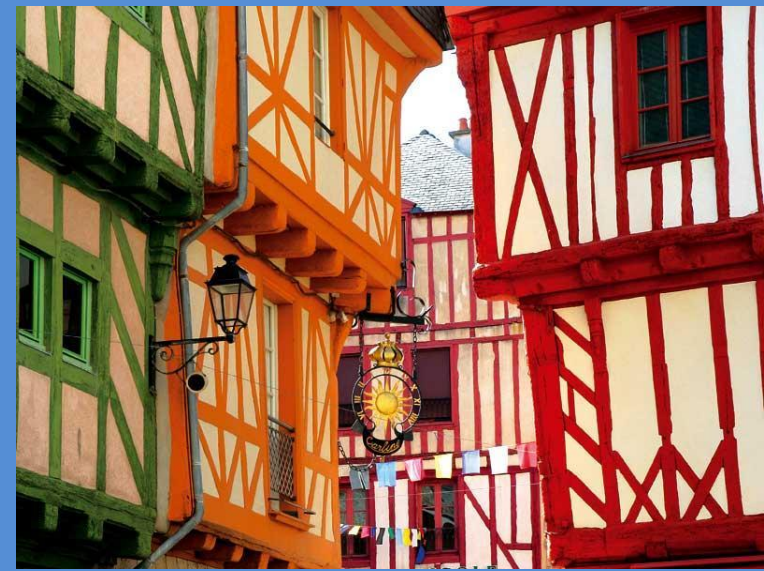
Maisons à pans de bois, Vannes