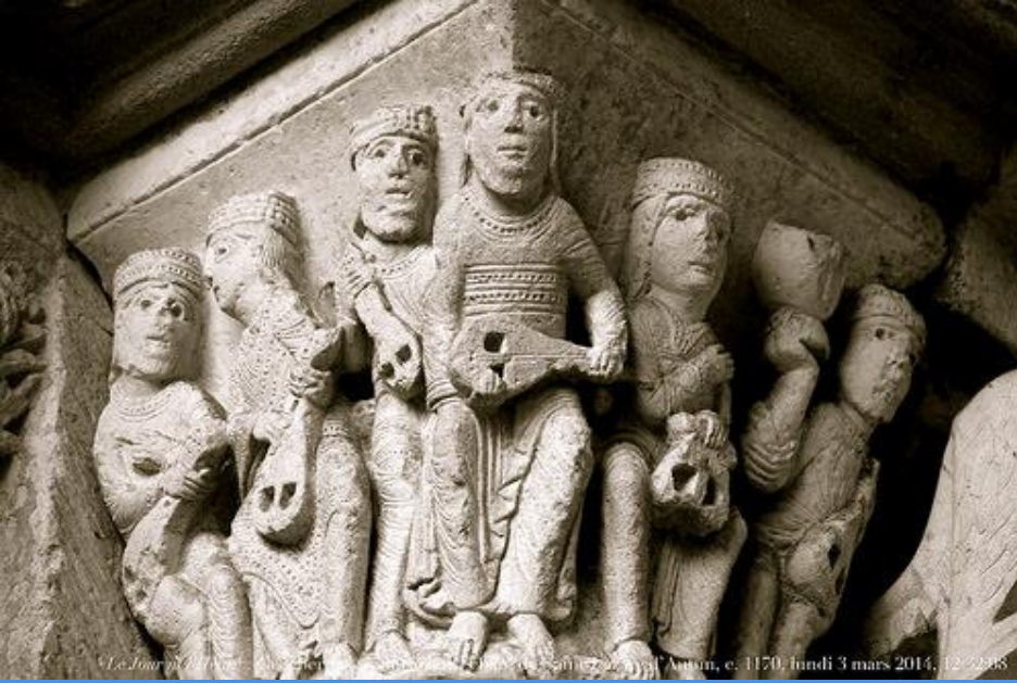
Chapiteau des vieillards de l'Apocalypse, v. 1170, Cathédrale Saint-Lazare, Autun