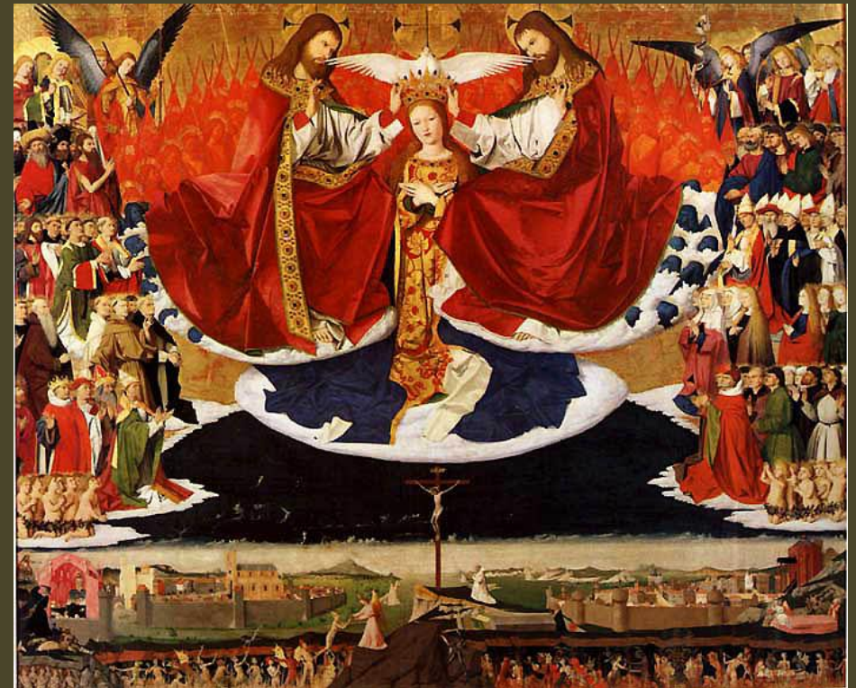
Le couronnement de la Vierge, 1454 – Enguerrand Quarton