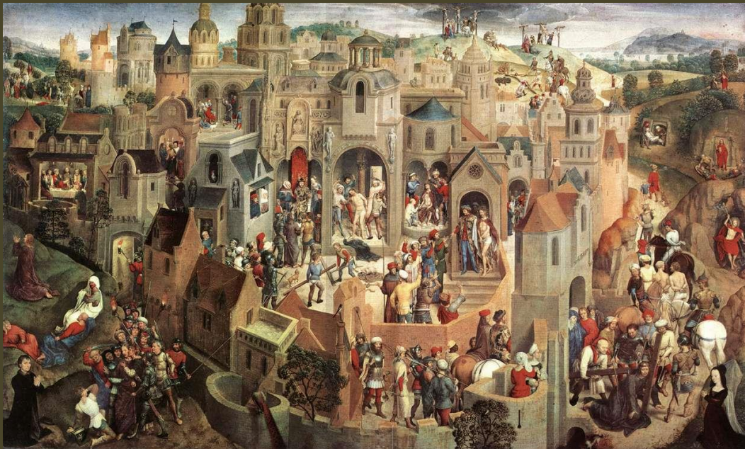
La Passion, v. 1470 – Hans Memling