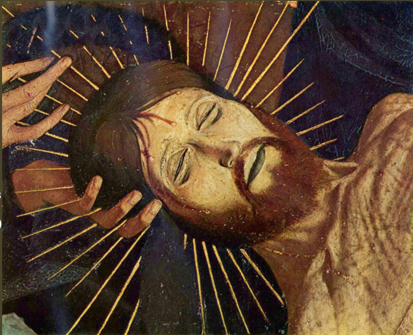
Détail de la Pietà de Villeneuve-lès-Avignon

Reproduire l'ensemble ou une partie des éléments de l'œuvre