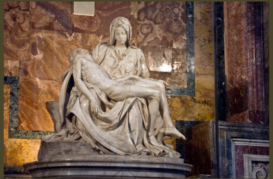
Pietà, 1499 – Michel Ange