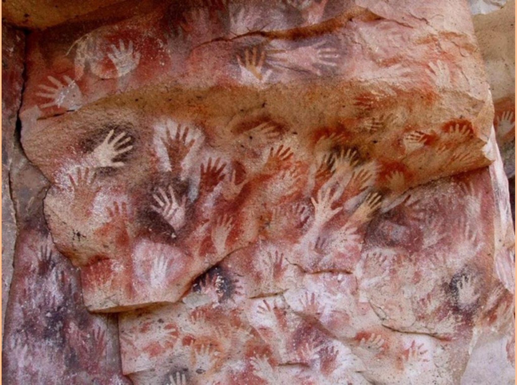
Cueva de las Manos , (la grotte des mains), Río Pinturas, - 5000 env., Argentine