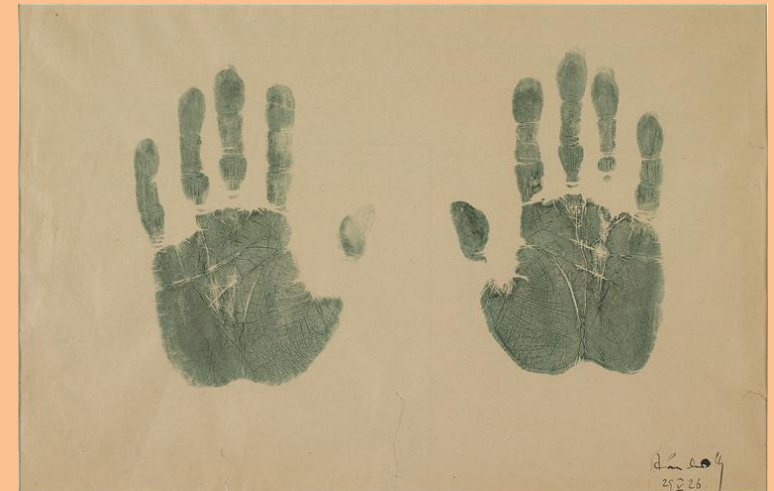
V. Kandinsky, Empreinte des mains de l'artiste, 1926, Paris