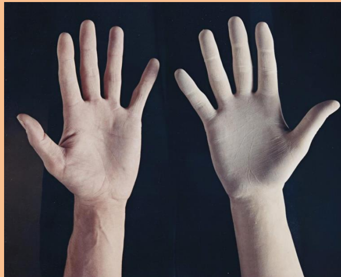
A. Penone, Guanto, 1972