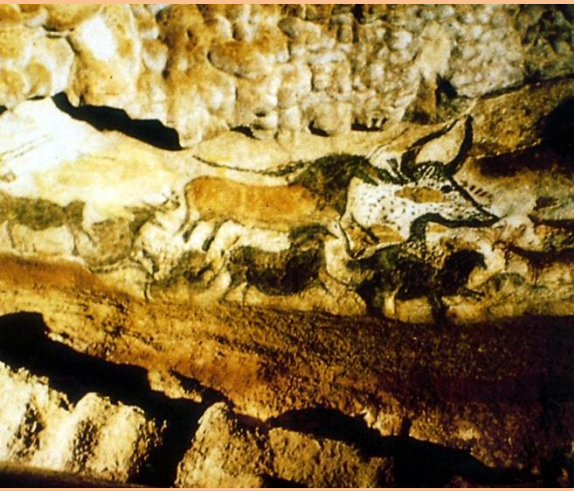
Grotte de Lascaux, entre 16000 et 13000 av. J.C.