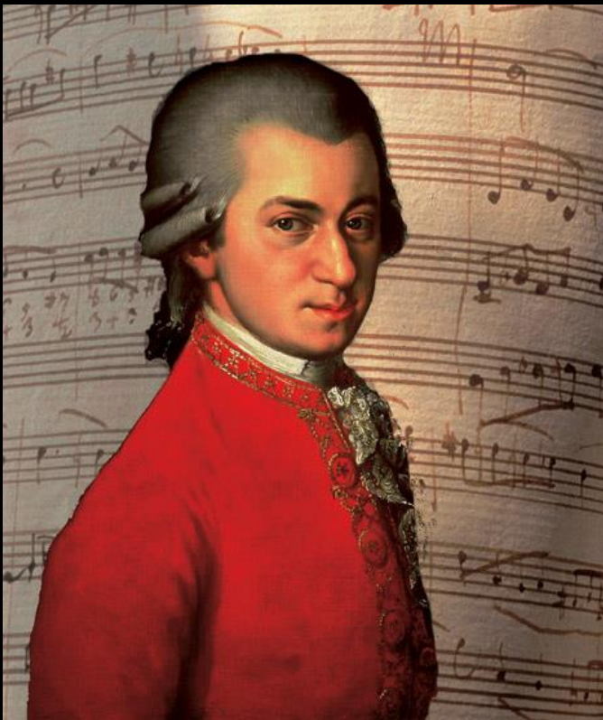
Portrait de Mozart ( Air de Papageno )