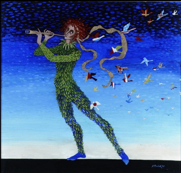
La flûte enchantée : Air de Papageno