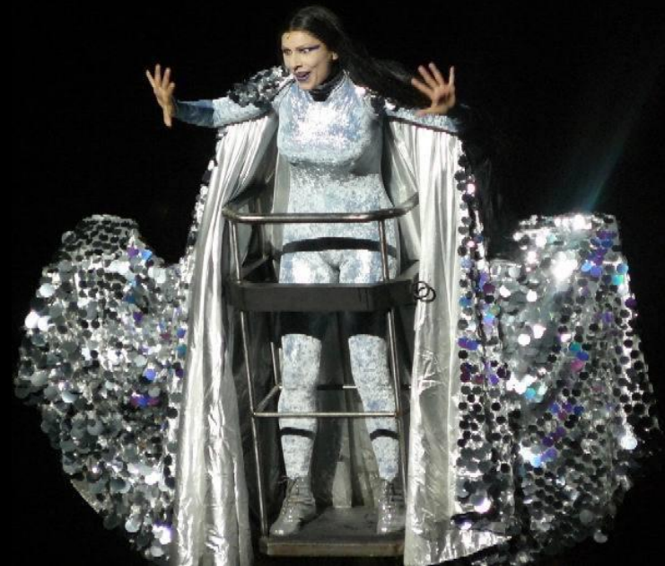
La flûte enchantée : air de la Reine de la Nuit