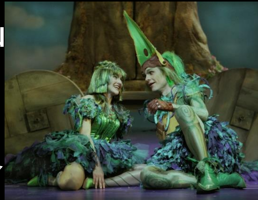
La flûte enchantée : Air de Papageno et Papagena

.Les voix à l'opéra : la voix d'une soprano