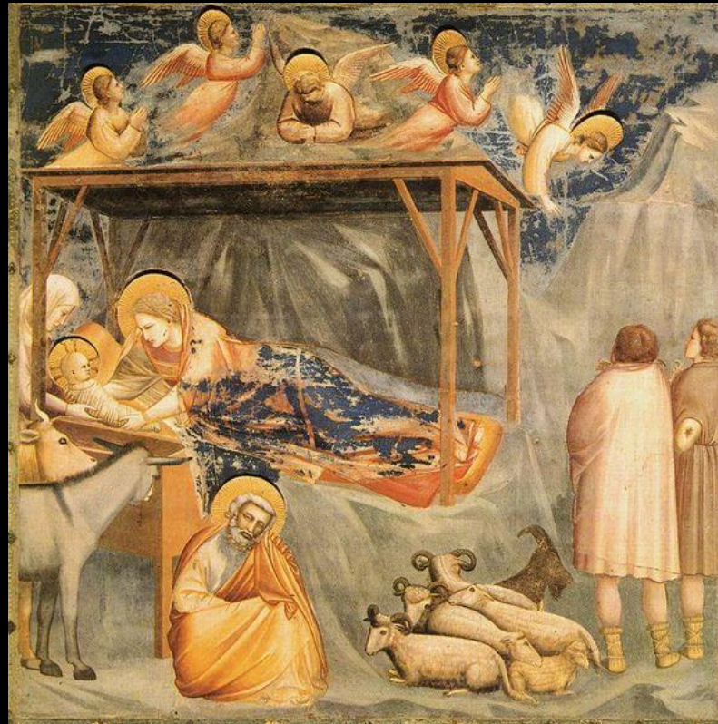
Nativité, XIVe s. - Giotto di Bondone