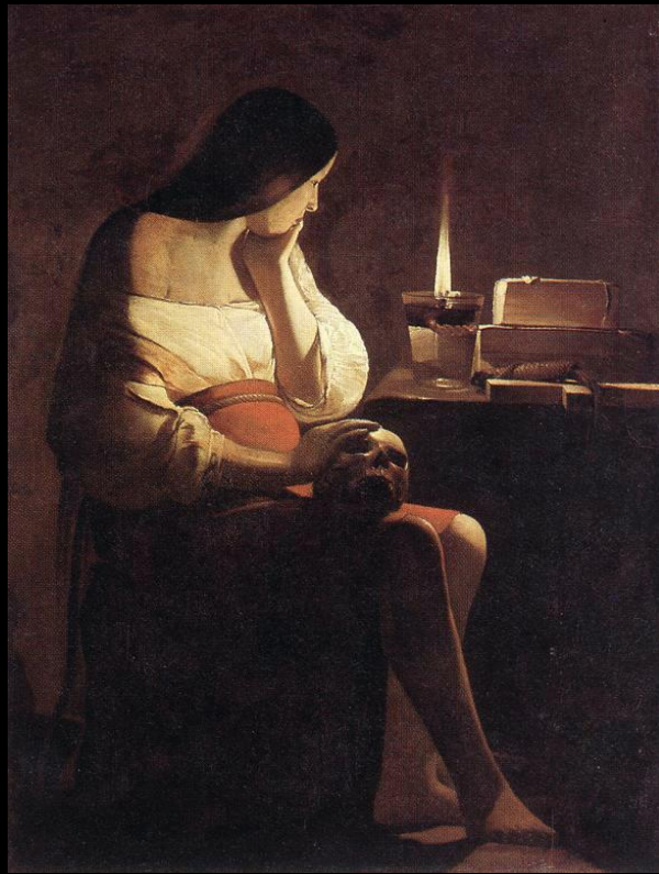
La Madeleine à la veilleuse, v.1630 – G. De La Tour