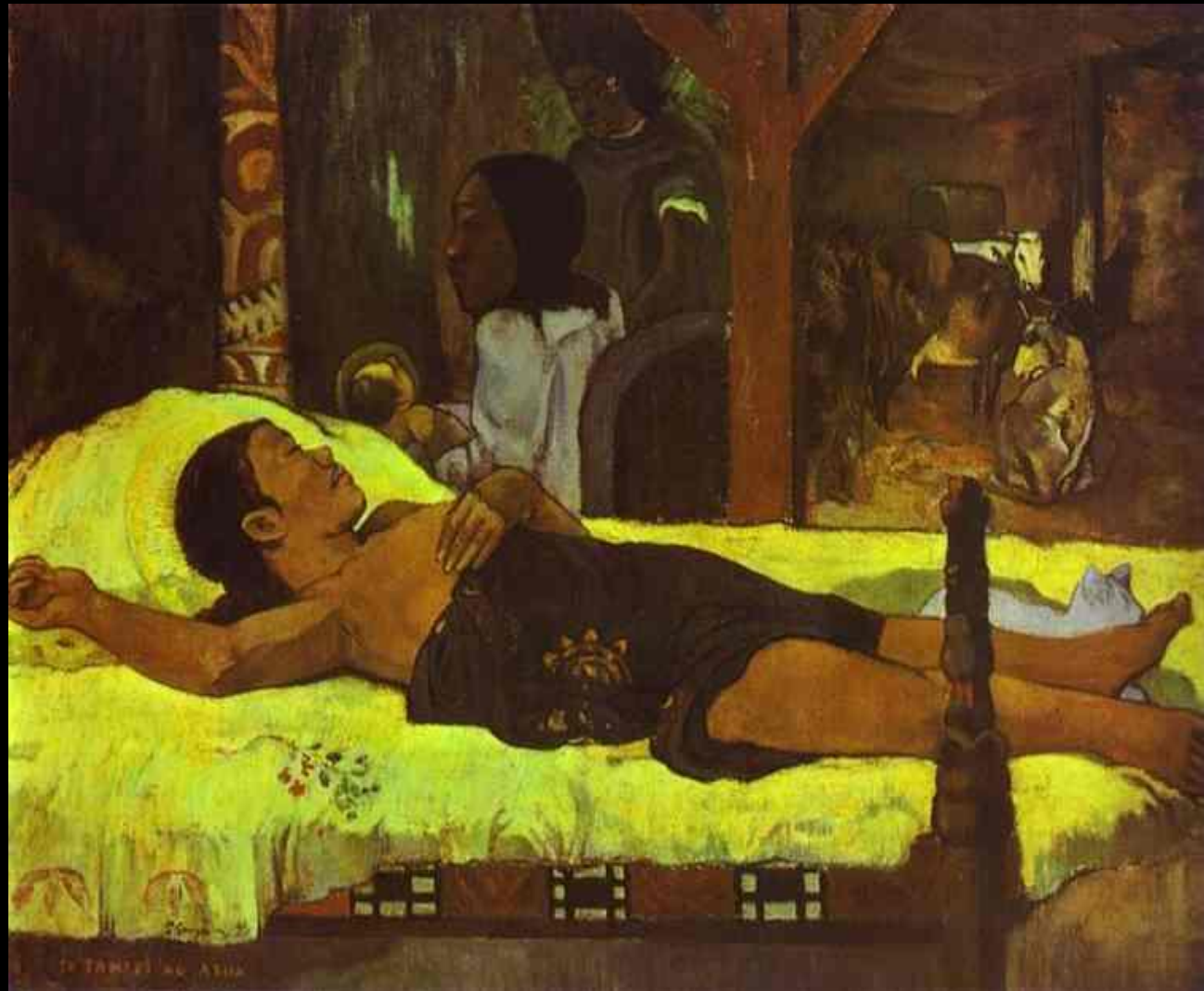
Te tamari no atua, 1896 - Gauguin

Sculpter, modeler les personnages de la crèche