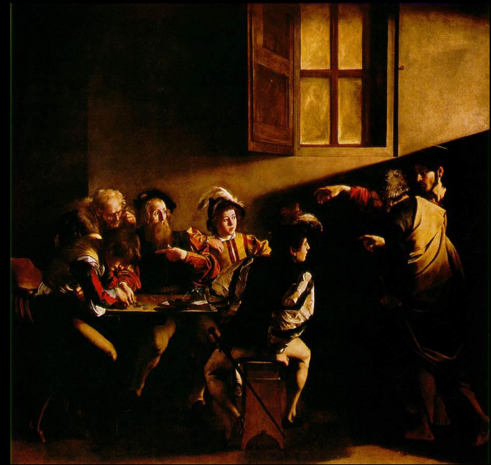
La vocation de Saint Matthieu, 1600 – Le Caravage