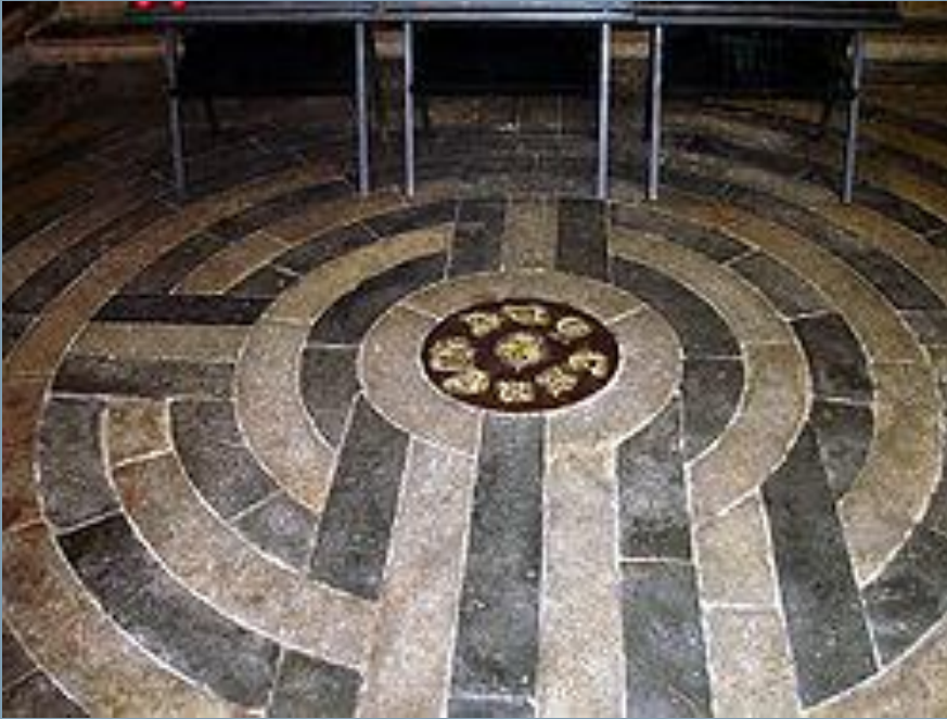
Basilique de Guingamp. 1852-1880