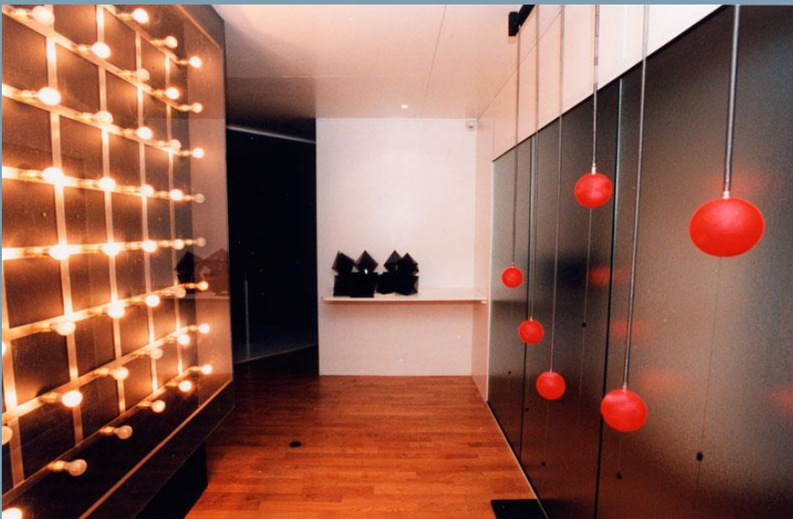
Labyrinthe du GRAV. 1963. musée d'Art et d'Histoire de Cholet