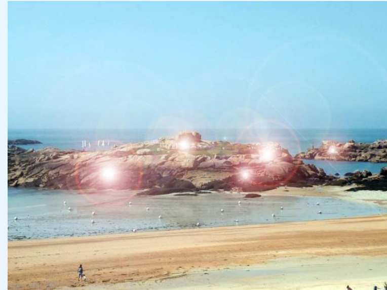
Festival d'art de l'Estran. Côte de granit rose http://www.festivaldelestran.com/