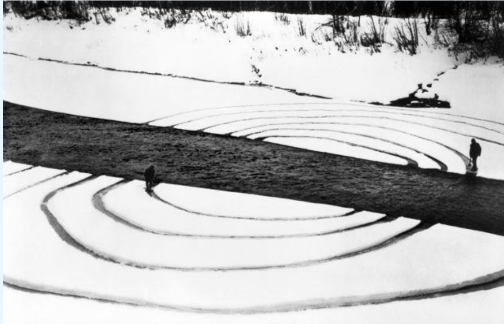
Dennis Oppenheim - Annual Rings - 1968