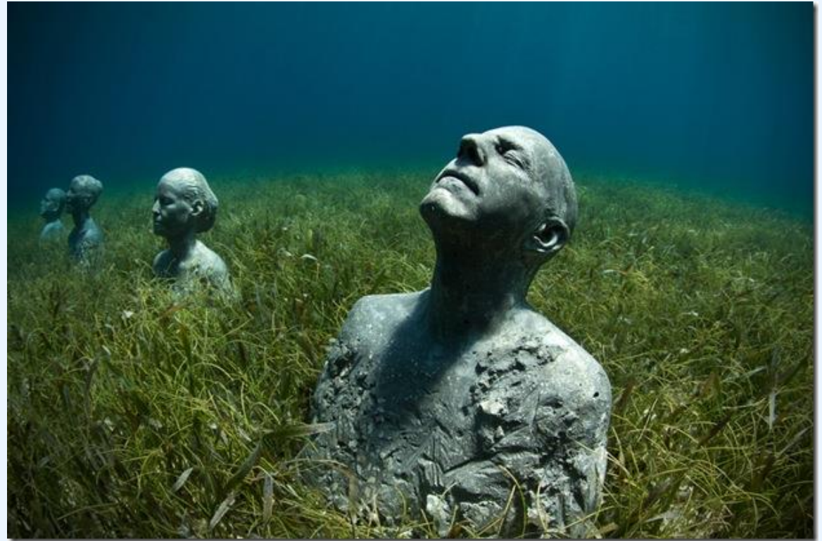
Jason deCaires Taylor, The anchors (Les ancres)