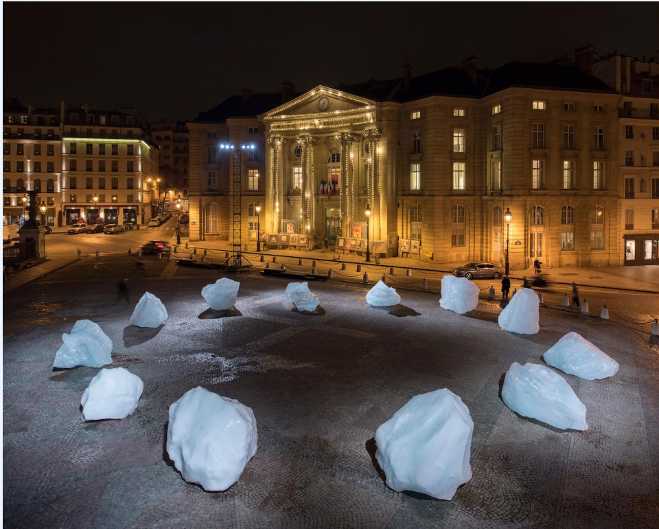
Olafur Eliasson, Ice Watch, 2014 Place du Panthéon, Paris, 2015